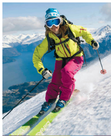
Product Manual Winter

Produktmanual vinter – Samarbeid med Fjord Norge